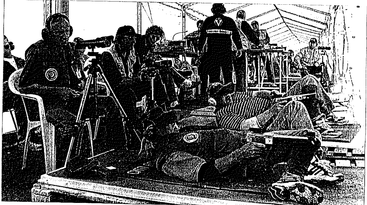
Liegend schießen die Silhouettenschützen mit Kurzaffen auf die Ziele aus Stahl. Jedem Schützen steht ein Beobachter oder „Spotter“, wie er in der Fachsprache heißt, zur Seite, der auch auf die korrekte Haltung der Waffe achtet.